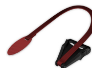
Udløssersnor CARA Full Face WM 25623

Yderligere informationer om vores terapiløsninger, tilbehør og maskesystemer findes på loewensteinmedical.com