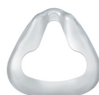
Maskepude CARA Str. XS: WM 25189 Str. S/M: WM 25238 Str. M/L: WM 25239