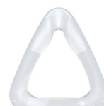
Maskepude CARA Full Face Str. S: WM 25601 Str. M: WM 25602 Str. L: WM 25603