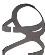
Zestaw mocujący XL CARA/CARA Full Face bez zatrzasków taśm podtrzymujących WM 25338