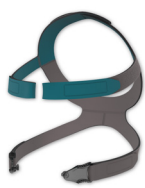
Zestaw mocujący CARA wł. z zatrzaskami taśm podtrzymujących XS: WM 25191 Standard: WM 25192