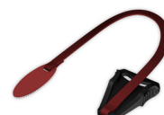
Linka zrywająca CARA Full Face WM 25623

Więcej informacji na temat naszych systemów terapeutycznych, akcesoriów i masek oddechowych znajdziesz na stronie loewensteinmedical.com