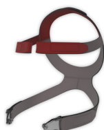
Zestaw mocujący CARA Full Face wł. z zatrzaskami taśm podtrzymujących WM 25243