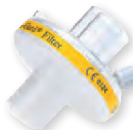
Bakterienfilter Ventilsystem Teleflex Iso-Gard WM 27591