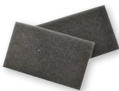
Set, 2 Luftfilter WM 29928