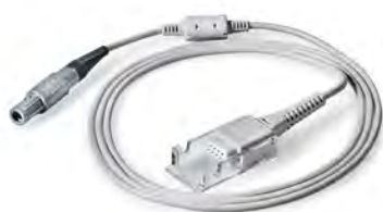
Verbindungsleitung SpO 2 WM 35581