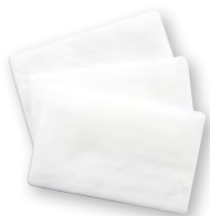
Set, 12 Pollenfilter WM 29652