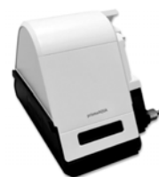
prismaAQUA Atemluftbefeuchter, weiß für prisma VENT

bestehend aus: - Befeuchteroberteil (WM 29492) - Befeuchterunterteil (WM 29682) - Befeuchtereinsatz (WM 29683) - Heizstab