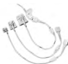
Softtipsensor SpO 2 module

Größe S WM 35532 Größe M WM 35533 Größe L WM 35534