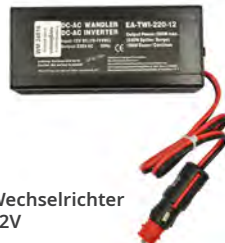
Wechselrichter 12V WM 24616