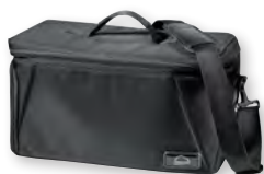
prismaBAG advanced Transporttasche für prisma VENT WM 29337