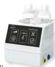
prisma VENT AQUA Atemluftbefeuchter

bestehend aus: - prisma VENT AQUA, Grundgerät (WM 100501) - Netzleitung, Standard - Heizdrahtverteilerkabel (i) (WM 100942) - Temperatursonde, 160 cm (WM 100910)