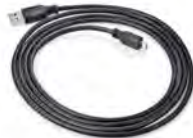
Micro-USB-Datenkabel WM 35160

Größe S LMT 29751 Größe M LMT 29752 Größe L LMT 29753