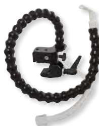
Set Leckageschlauch für Mundstückbeatmung WM 27647