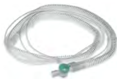
Einschlauch-Ventilsystem 22 mm Ø LMT 27181