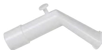
Mundstück für MPV WM 27646

Größe S WM 35532 Größe M WM 35533 Größe L WM 35534