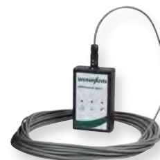
VENTiremote alarm 10 m Kabel WM 27745 30 m Kabel WM 27755