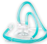
Einschlauch-Ventilsystem, beheizt (i), Autofill-Kammer, 150 cm + 60 cm 15 mm Ø WM 271707 22 mm Ø WM 271708