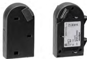
prismaCONNECT Kommunikationsmodul WM 29670

ab FW 3.5.0004 WM 15976 alle FW-Versionen WM 15876