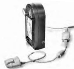
prisma CHECK SpO 2 -Modul für prisma-Geräte WM 29390