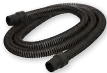
Leckageschlauch, 22 mm Ø, schwarz WM 23962