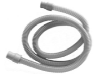
Leckageschlauch, 15 mm Ø WM 29988