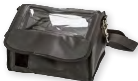
Transporttasche für mobilen Einsatz WM 30633