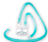
Leckageschlauch, beheizt (i), Autofill-Kammer, 150 cm + 60 cm 15 mm Ø WM 271705 22 mm Ø WM 271704