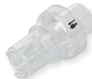
Silentflow 3 Ausatemventil WM 25500