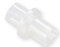
WILAsilent Ausatemventil WM 27589