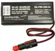
Wechselrichter 24V WM 24617