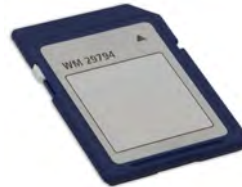
SD-Karte WM 29794