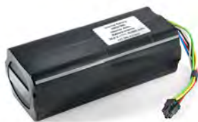
Ersatzakku intern verpackt, für prisma VENT

ab FW 3.5.0004 WM 15976 alle FW-Versionen WM 15876