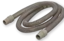
Leckageschlauch, 22 mm Ø, autoklavierbar WM 24667