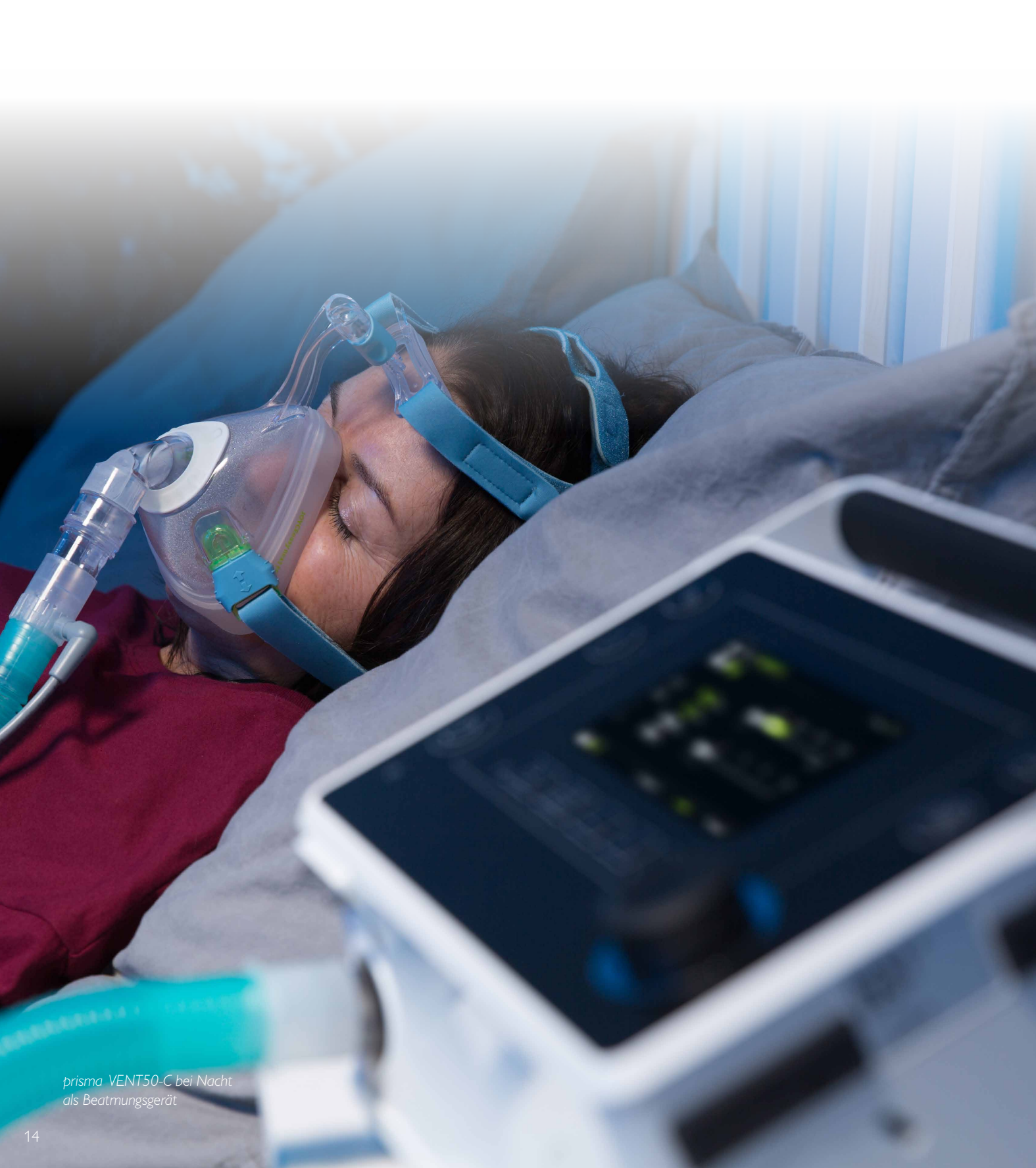
prisma VENT50-C bei Nacht als Beatmungsgerät

den Schlaf wird dann auf die Beatmungstherapie gewechselt, da hier häufig höhere Beatmungsdrücke nicht zuletzt auch zur Offenhaltung der oberen Atemwege notwendig sind, welche die High-Flow-Therapie nicht bereitstellen kann. So kann der Patient quasi einen maßgeschneiderten Therapieplan erhalten, ohne dass verschiedene Geräte zum Einsatz kommen müssen, was letztlich auch die Kosten reduziert. Der Hochleistungsbefeuchter prisma VENT AQUA kann dabei ebenfalls für beide Modi verwendet werden.