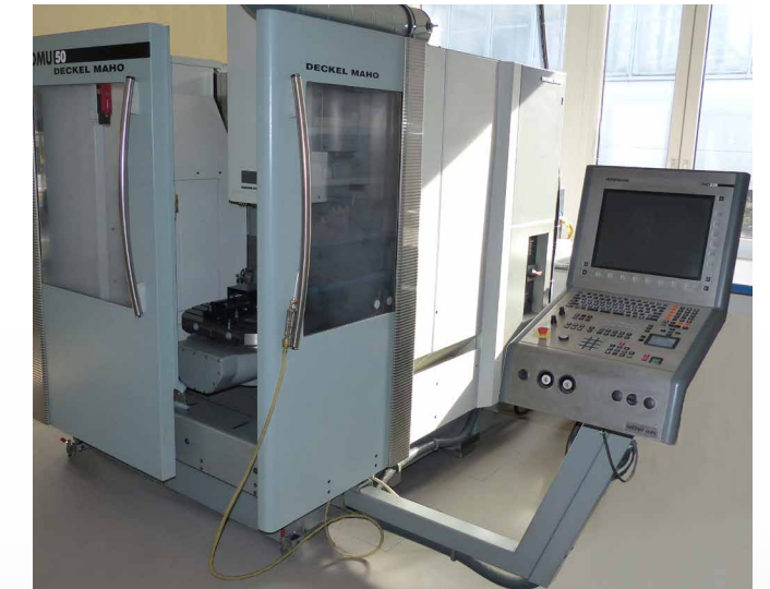
Fräsmaschine zur Erstellung von Aluformen

Nach ungefähr 6 – 8 Wochen sind diese Tests abgeschlossen und ausgewertet. Wahrscheinlich wird das Patient Interface Team von Löwenstein Medical Technology diese Tests noch mehrmals wiederholen müssen, bis am Ende ein neues Maskenkissen entstanden ist, welches den hohen Anforderungen der vielen verschiedenen Patienten weltweit standhält.