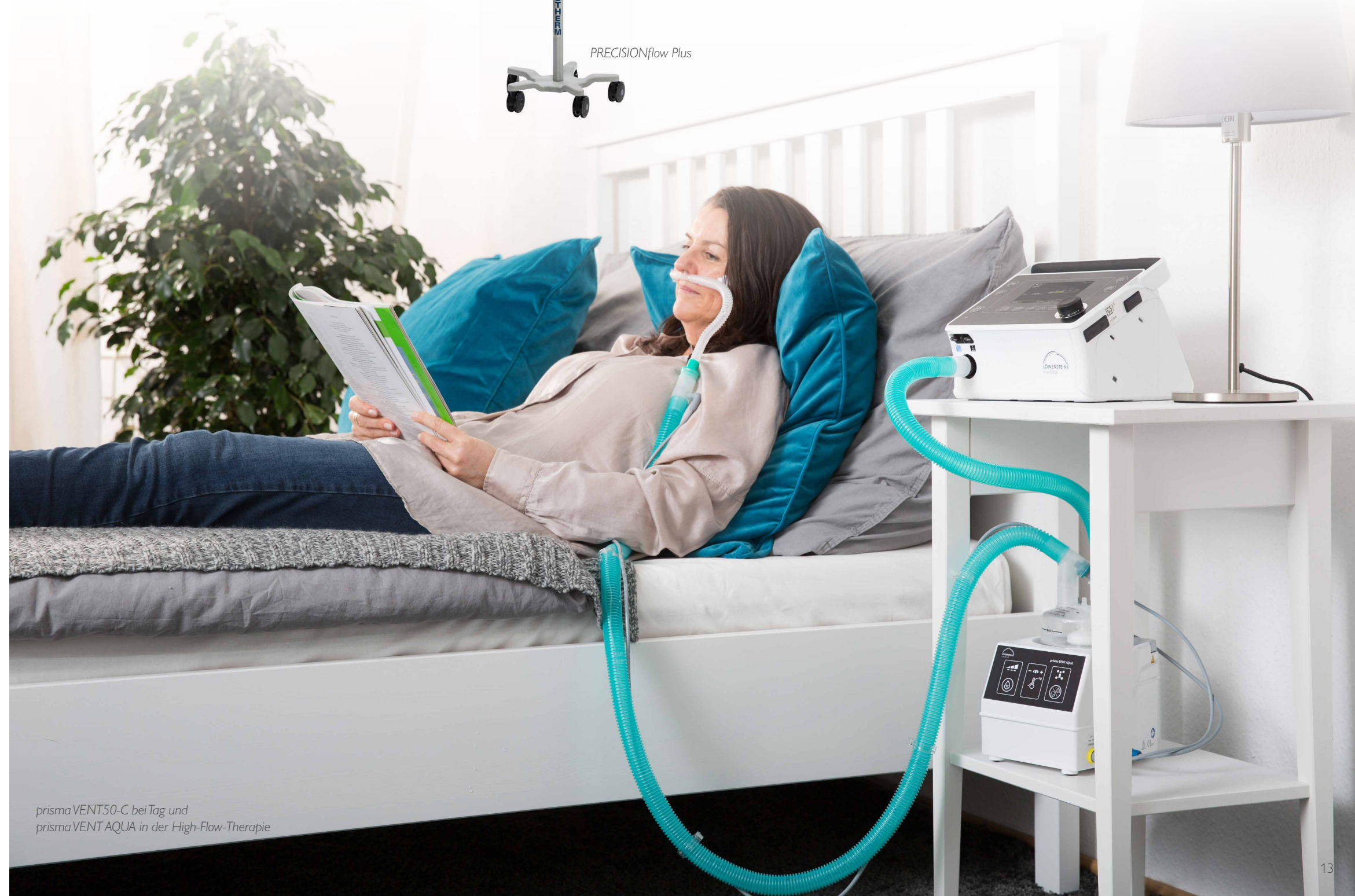
prisma VENT50-C bei Tag und prisma VENT AQUA in der High-Flow-Therapie