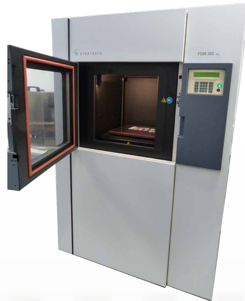
Professioneller 3D-Printer für die Erstellung von Funktionsmustern

Sind die Mitarbeiter des Patient Interface Teams zufrieden, werden im Rapid Prototyping Center Aluformen gefräst. Dieses ist zeit- und kostenintensiver als Formen aus dem 3D-Printer zu drucken. Der Vorteil hingegen ist, dass die Maskenkissen-Oberfläche einem echten Maskenkissen entspricht und somit von jedem, auch über Nacht, getragen werden kann.